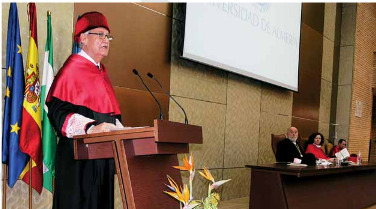
Escuredo durante la lectura de su discurso.